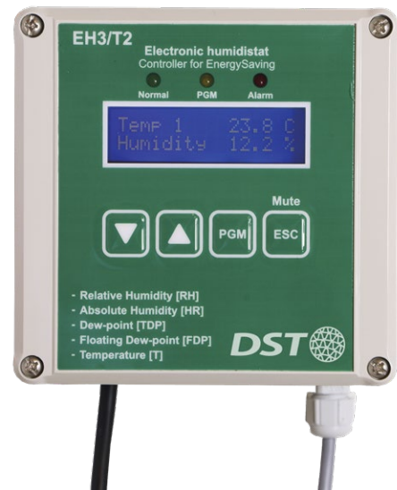
EH3 T2 avec affichage rétro-éclairé, uniquement disponible chez Seibu Giken DST

Deux contacts à fermeture: Sur chaque relais, vous choisissez un des quatre paramètres à régler. Vous pouvez ainsi contrôler un déshumidificateur d'air en deux étages ou contrôler deux déshumidificateurs indépendants. Ou bien vous pouvez utiliser un des relais pour contrôler la déshumidification et l'autre relais pour contrôler la température.