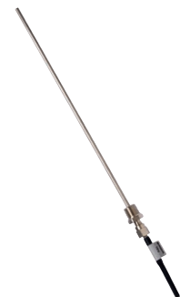
Capteur d'immersion. (option), également disponible pour installation en applique